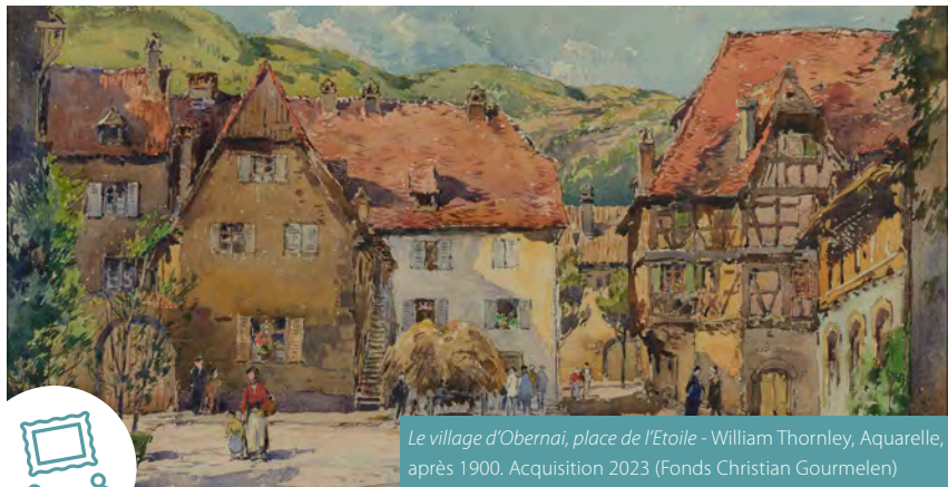
Le village d'Obernai, place de l'Etoile - William Thornley, Aquarelle, après 1900. Acquisition 2023 (Fonds Christian Gourmelen)