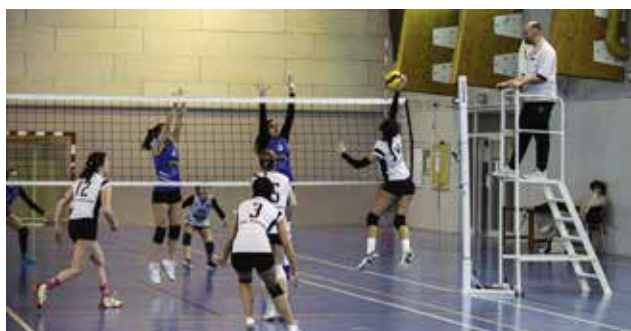
Ici, l'équipe féminine senior en plein match au stade Roger Moritz.

L'Association de Volley-Ball Osny Pontoise reçoit pour la 3 e année consécutive le label bronze « Club Formateur », un gage de qualité qui s'accompagne de résultats remarquables. Zoom sur un club qui monte.