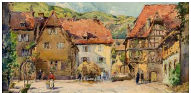
Le village d'Obernai

Ce nouvel accrochage présentera tous les médiums pratiqués par l'artiste (huiles, dessin, sépia, aquarelle et gouache) et des œuvres issues des différents fonds du musée. Petits et grands formats se côtoieront, montrant la multiplicité des réalisations de William, de 1879 à sa mort en 1935.