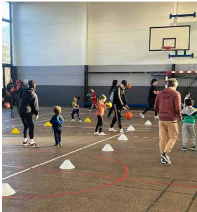
Séance « Sport en famille » le 16 décembre dernier avec Ex-Aequo.