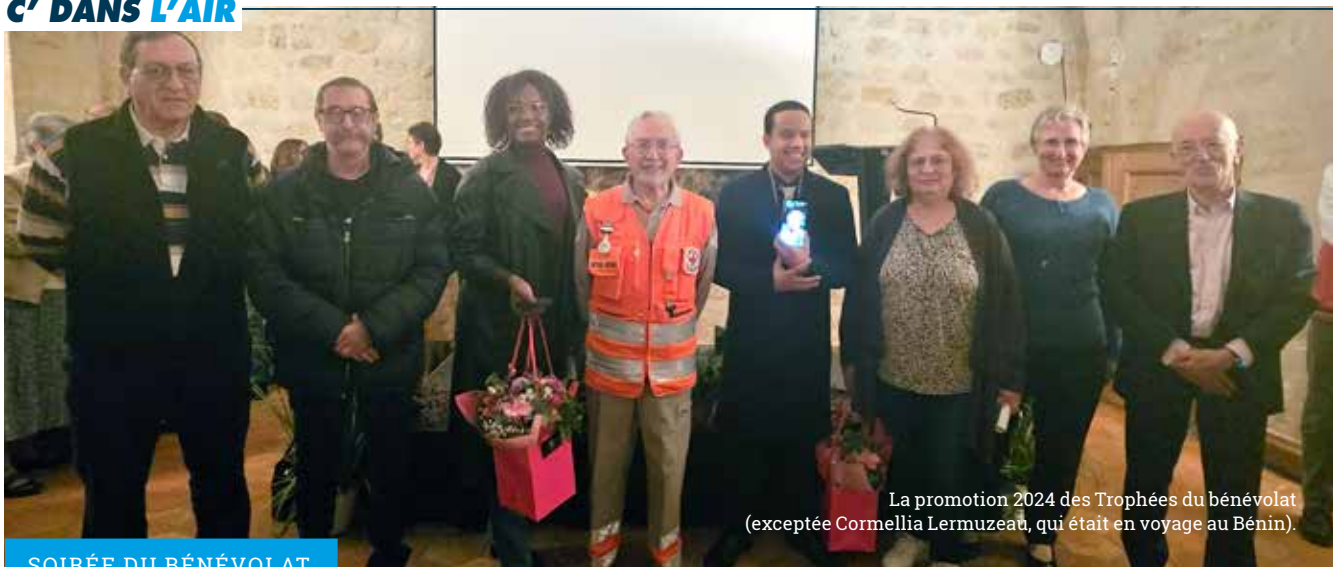
La promotion 2024 des Trophées du bénévolat (exceptée Cormellia Lermuzeau, qui était en voyage au Bénin).