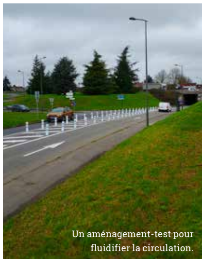
Un aménagement-test pour fluidifier la circulation.

Depuis le 7 février, et de façon temporaire, une nouvelle configuration est proposée à ce croisement problématique. Suivez bien le marquage au sol et le double-alignement de balises.